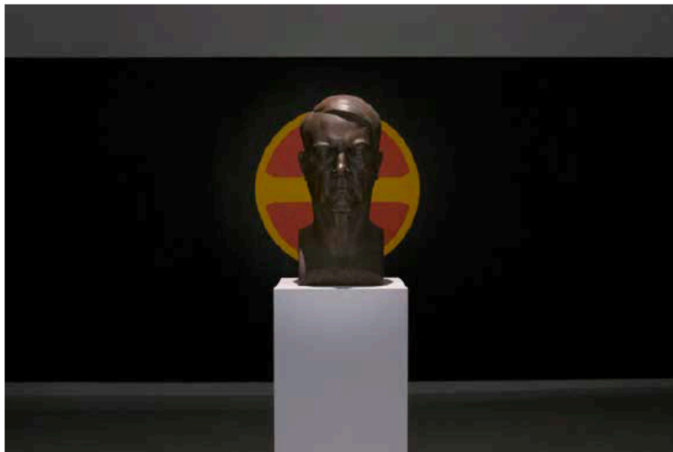
Wilhelm Rasmussens Quisling skuer innover utstillingen ALLEFOTO: JOHAN OTTO WEISSER

● Utstillingen gir en opplevelse av å være til stede. Usikkerheten og sorgen, mer enn sinne og aggresjon, alvor og innbitt mot-