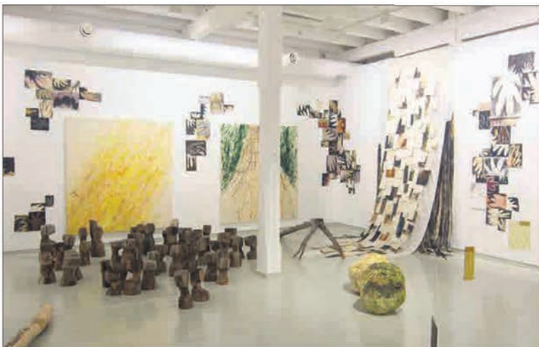
TIL STEDE: Fra Norske Tekstilkunstners jubileumsutstilling via Wildlife skulpturpark på Nesodden til Arendal. Være overalt denne våren.