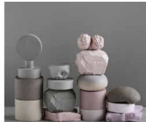
Still Life, 2017, porselen steingods.